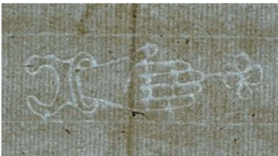
filigran – znak wodny w papierze

Obecnie kojarzony z cyfrowym zabiegiem, w którym logo lub fragment tekstu nakłada się na dokument lub obraz w celu ochrony praw autorskich.